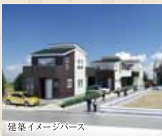
建築イメージバス